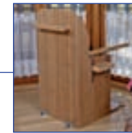
Rückseite von LuSan ® inklusive Haltegriff (dunkler Bambus)