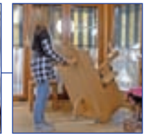
LuSan ® ist leicht zu transportieren und zu demontieren

Außenseite kann mit Ablegeschalen oder z. B. auch mit Tischplatten ergänzt werden