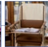
Praktisches Zubehör: Einhänge-Tischplatte (heller Bambus)